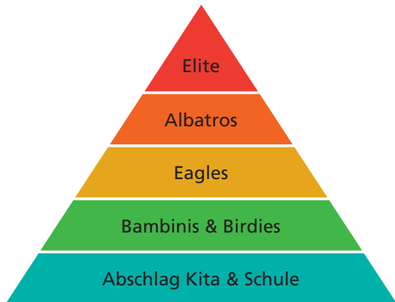
Trainingsgruppen nach Alter und Spielstärke

Für die Teilnahme an dem Gruppentraining fallen keine weiteren Kosten an.